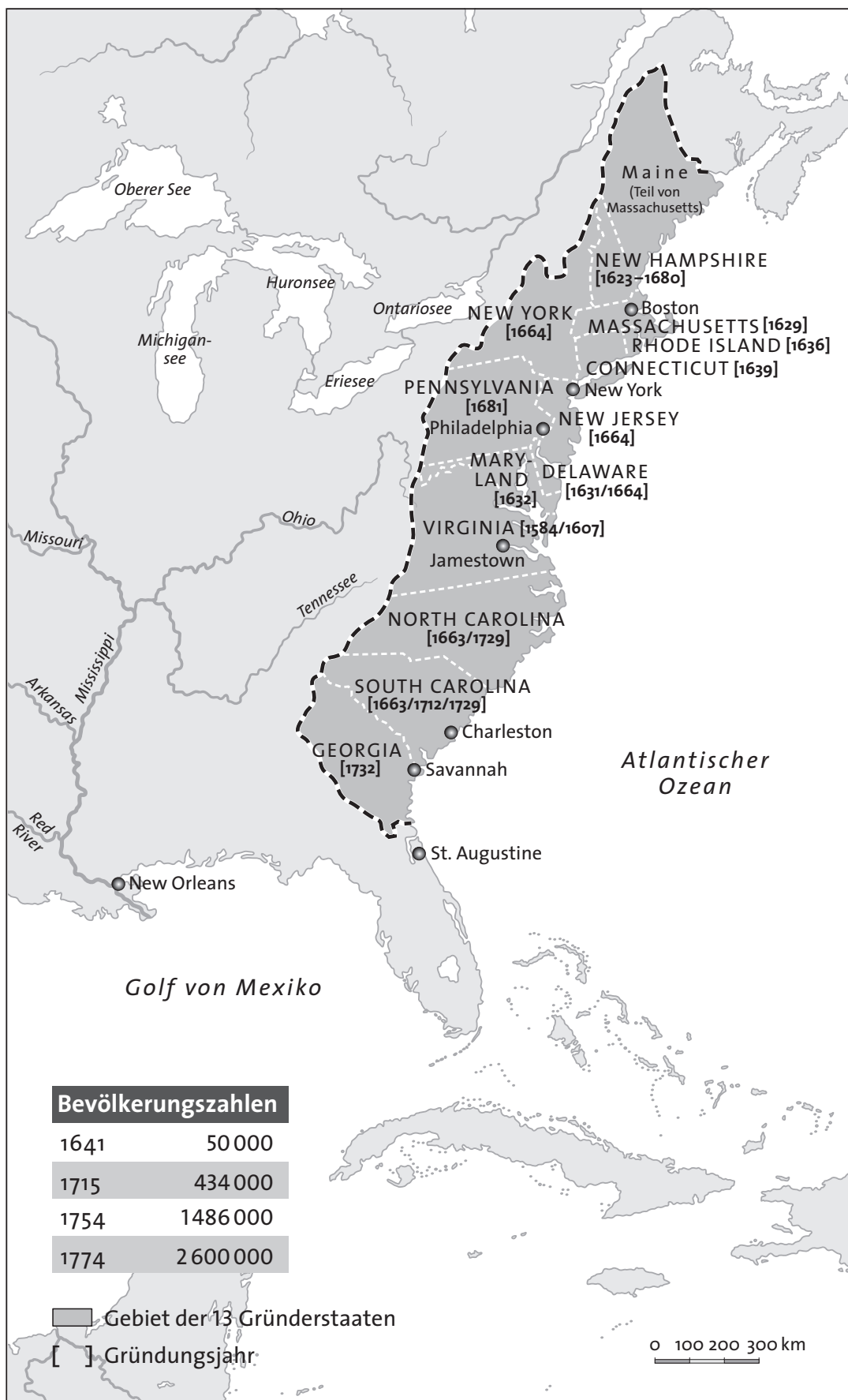
Die 13 Gründungskolonien