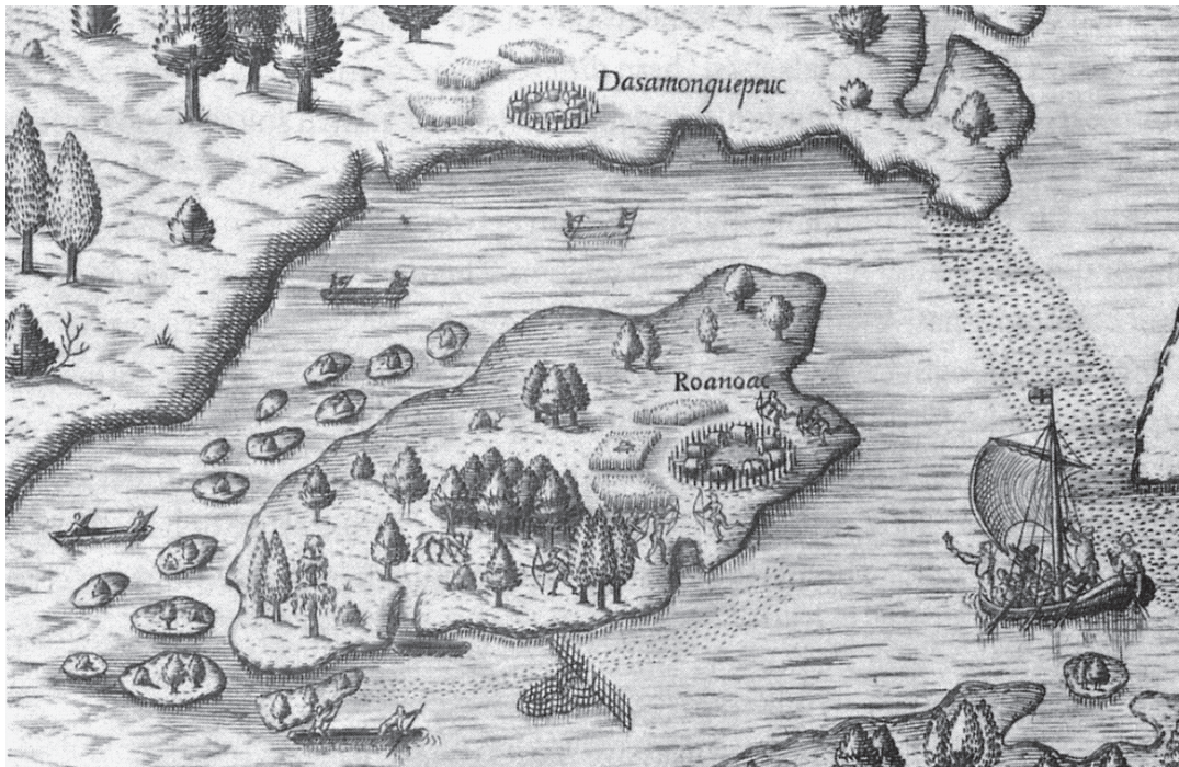
Bilder aus der Neuen Welt Die «Lost Colony» Roanoke in der Darstellung von John White (um 1590)

schen Fort St. Augustine an der Nordostküste Floridas, das noch Menéndez nach der Vertreibung der Protestanten in Auftrag gegeben hatte, um den Machtanspruch Madrids zu markieren. Das schloss den weiteren Ausbau der katholischen Missionsgebiete ein, die von Mittelamerika her auch den heutigen Südwesten und Westen der USA erfassten. Die Spanier beließen es dann allerdings bei einigen wenigen Außenposten, zumal diese, wie Santa Fe im heutigen Bundesstaat New Mexico, nur mühsam gegen die dort ansässigen Indianerstämme gehalten werden konnten. Als Missionen nördlich des Rio Grande entstanden bis ins 18. Jahrhundert unter anderem San Antonio im heutigen Bundesstaat Texas (1718) sowie die im heutigen Kalifornien liegenden Städte San Diego (1769), San Francisco (1776) und Los Angeles (1781). Auch an der Westküste trafen Engländer und Spanier früh aufeinander, wenngleich eine direkte Konfrontation nicht stattfand. Francis Drakes Weltumsegelung, die sogenannte Famous Voyage zwischen 1577 und 1580, führte ihn, nachdem er Kap Hoorn umschiffte, auch an die Westküste der späteren USA. Der Ort ist unbekannt, möglicherweise war es eine Bucht nordwestlich des heutigen San Francisco, die man heute noch «Drake's Bay» nennt. Dort begegnete er Angehörigen vom Stamm der Miwok (Miwuk) und legte wohl eine kleine Befestigung an. Der zweite, dessen Expedition an die